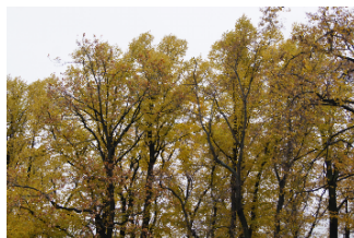
Фото автора интервью Даши Славиной